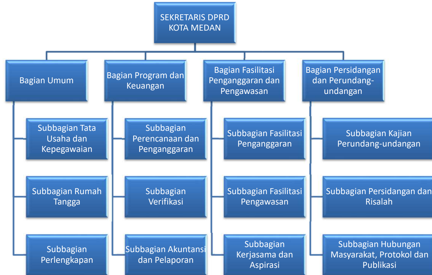
Gambar 2.1 Struktur Organisasi Sekretariat DPRD Kota Medan