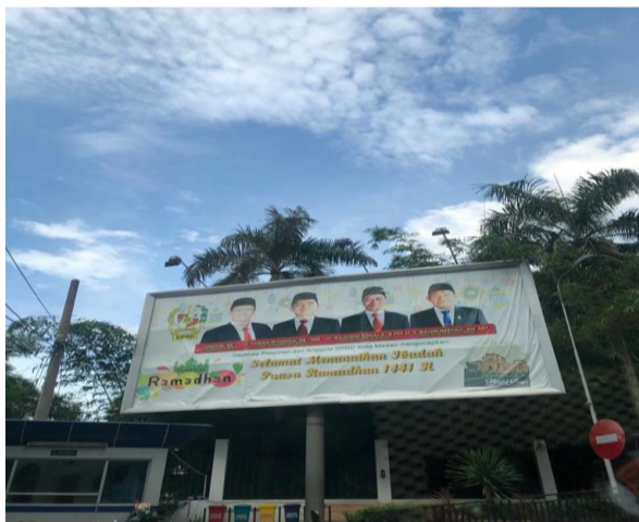
Gambar 3.12.2 Baliho Ucapan Hari Besar Keagamaan oleh Pimpinan DPRD Kota Medan.