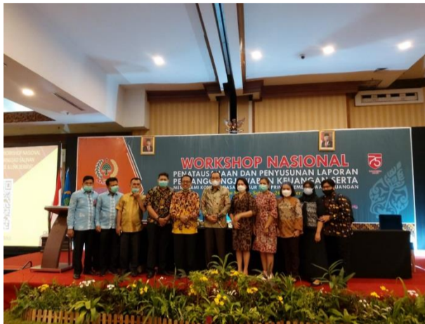
Gambar 3.8.1 Kegiatan Bimbingan Teknis ASDEKSI Tahun 2020.

Beberapa Kegiatan yang sudah dilaksanakan terkait Program peningkatan Kapasitas Sumber Daya Aparatur antara lain sebagai berikut :