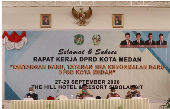
Gambar 3.11.2 Rapat Kerja DPRD Kota Medan Tahun 2020

Pelaksanaan Rapat Kerja DPRD Kota Medan Tahun 2020 dilaksanakan 1 (satu) kali pada tanggal 27-29 September 2020 yang bertujuan untuk menyusun Program Kerja DPRD. Hasil Rapat Kerja DPRD Kota Medan tersebut adalah dokumen Program Kerja DPRD yang akan dilaksanakan kemudian.