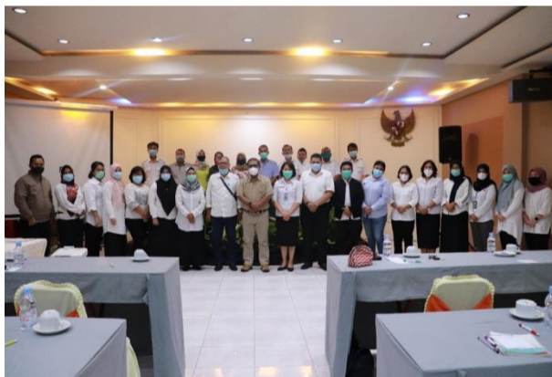
Gambar 3.8.2 Kegiatan Coaching Klinik Penatausahaan Keuangan di Parapat, 4-5 Desember 2020.