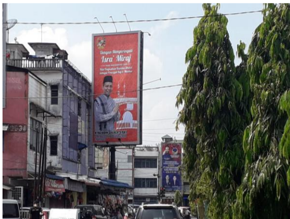
Gambar 3.12.1 Baliho Ucapan Hari Besar Keagamaan oleh Pimpinan DPRD Kota Medan.

Adapun kegiatan yang mendukung suksesnya pelaksanaan program ini adalah kegiatan “Penyebaran Informasi Melalui Media Luar Ruang Baliho Dan Spanduk”. Hasil kegiatan adalah sebagaimana ditunjukkan pada gambar berikut :